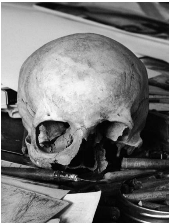
Ateliertisch, 2010; Foto: Claudio Barandun, Luzern (Buchumschlag)