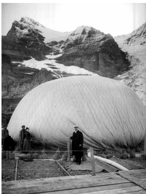
Füllung des Ballons „Stella“ bei Station Eiger-Gletscher für die Alpenfahrt vom 20. September 1904 Im Vordergrund mit Mütze Kapitän Eduard Spelterini