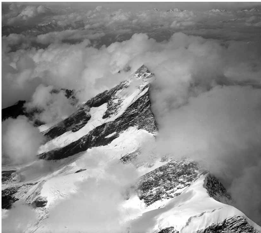
Eduard Spelterini, Laquinhorn, 3. August 1913, Eidg. Archiv für Denkmalpflege, Graphische Sammlung der Schweizerischen Nationalbibliothek

Unterstützt durch die Otto Pfeifer Stiftung, den Kanton Luzern und den Fuka-Fonds der Stadt Luzern.